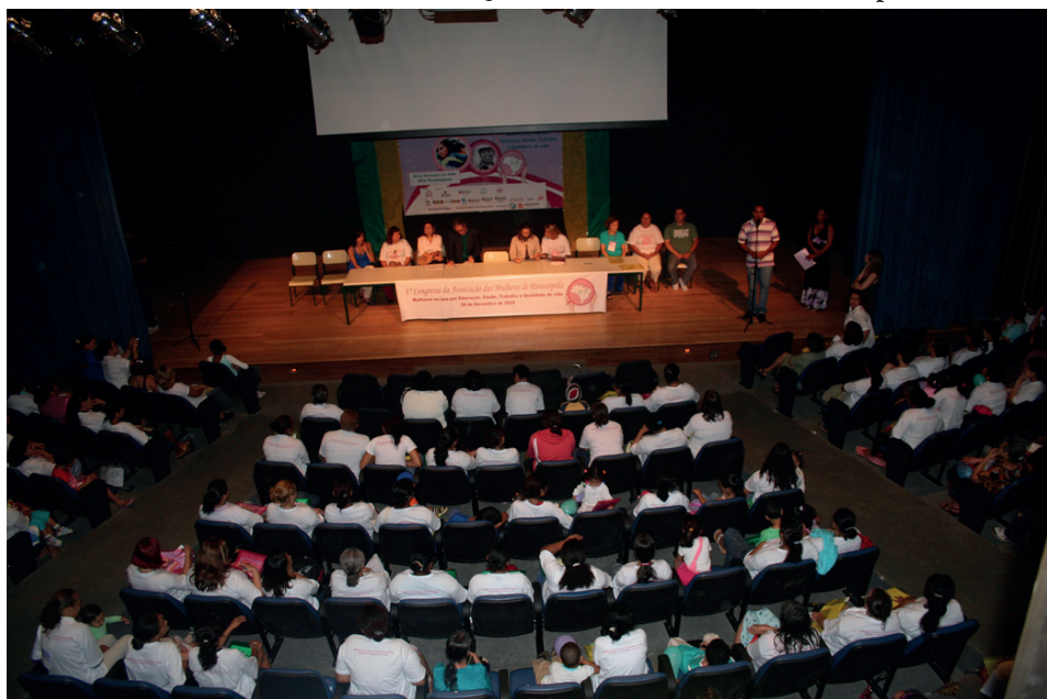
1º Congresso da Associação das Mulheres de Paraisópolis