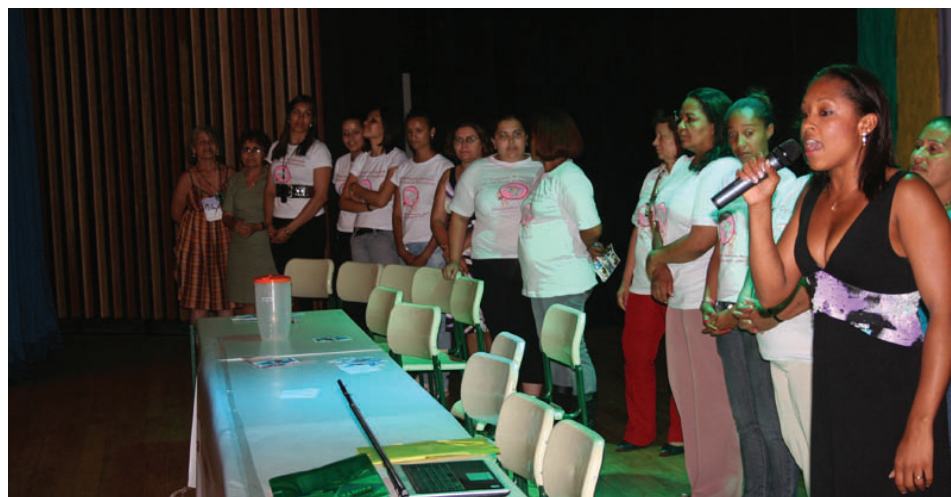
Nova diretoria da Associação das Mulheres de Paraisópolis

Presidente da Associação das Mulheres de Paraisópolis