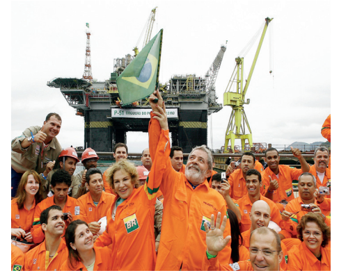
Presidente Lula vem a Paraisópolis inaugurar a Rádio Comunitária e obras do PAC Página 3

Paraisópolis - São Paulo - Março/Abril de 2010 - Ano IV