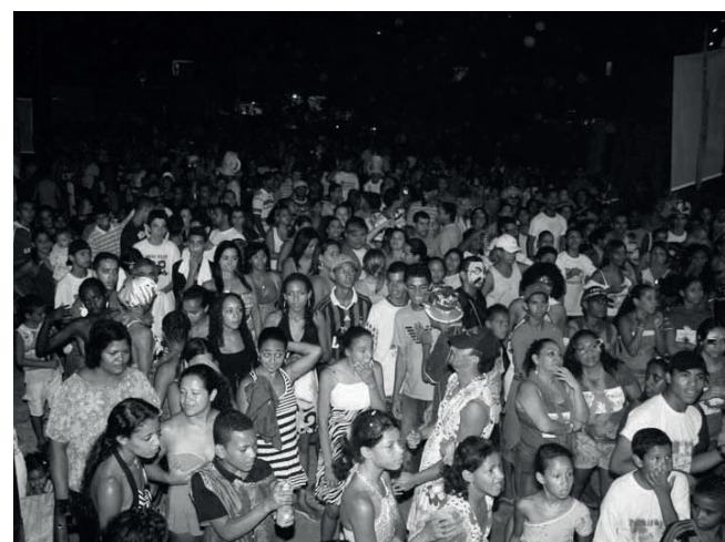
Foliões aguardando a exibição de grupos da comunidade

com as diversas culturas existentes dentro e fora da sua própria região.