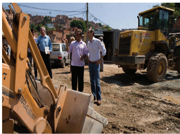
Paulo Skaf, presidente da FIESP, durante visita a Paraisópolis em que fechou parceria para instalação da Indústria do Conhecimento, que contará com sala de informática e biblioteca