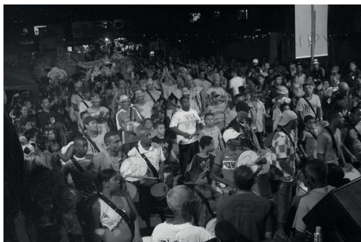
Concentração com baterias do Barracão dos Sonhos e da Vila Belém

O objetivo da União e da AMP é criar a escola de samba da própria comunidade, realizando a integração do morador