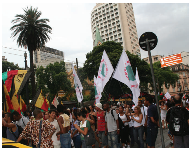
Paraisópolis sempre presente na comemoração do Dia da Consciência Negra