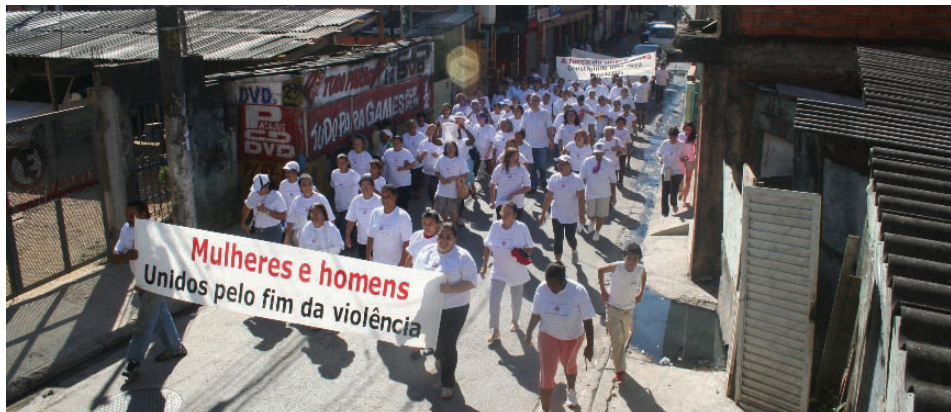
Caminhada percorreu ruas de nossa comunidade

As moradoras presentes assistiram a palestra de esclarecimento sobre HIV/AIDS, meios de prevenção e atual situação da epidemia no mundo e no Brasil.