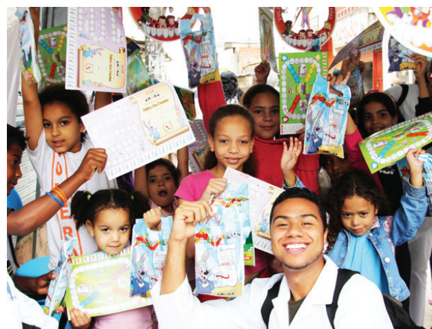
Operação Saúde na União dos Moradores