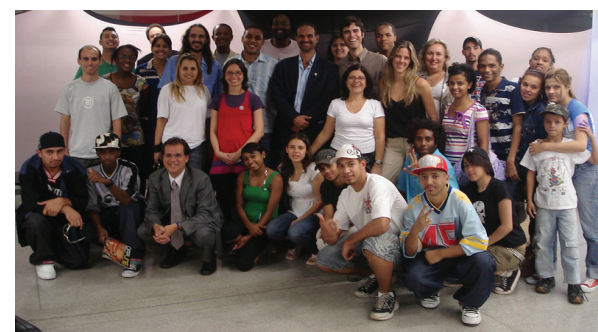
Paraisópolis representada nos Conselhos Municipal e Nacional da Juventude e Conselho Nacional da Saúde