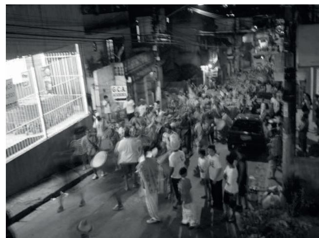
Bloco desfilando pela comunidade, na Rua Rudolf Lotze